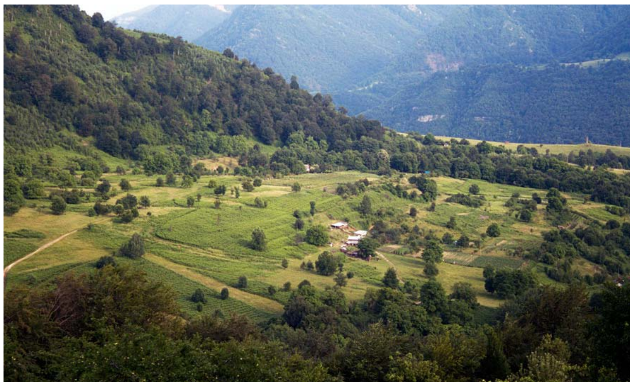
Снимка 58 Земеделски практики в ЗЗ „Васильовска планина”