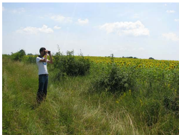
Снимка 52 Експерт по време на проучване в 33 Деветашко плато