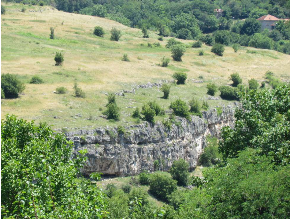
Снимка 53 Местообитания, обект на проучване в ЗЗ Деветашко плато