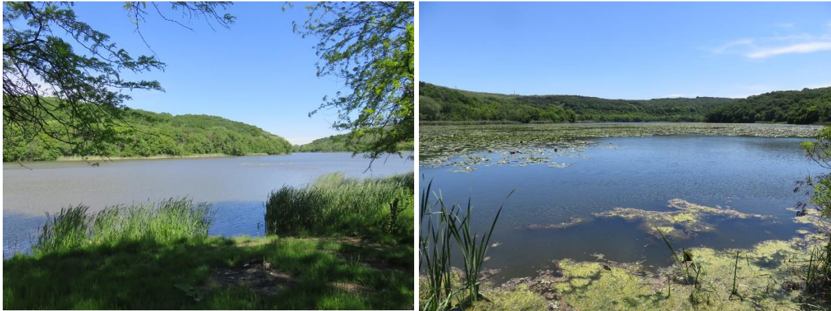
Сн. 1 Защитена зона BG0002065 „Блато Малък Преславец“

Настоящият документ включва следните раздели с важна информация: